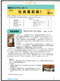
編集長による巻頭言がトップページ。上部には目次があります。

<概要> 毎月20日発行 (祝祭日はその前日)、メールにてPDFファイルでお届けします (パスワード付き) A4サイズ15ページ程度 ホームページ: http://www.e-comon.co.jp/saizensen/