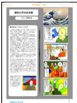
人生の帰路にどのように出処進退するか。生き様シリーズ。