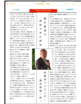
編集部からコラムをお願いしたり、談話をいただくコーナー。