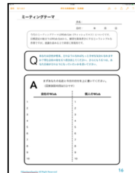
そのまま研修やミーティングに使える資料を毎月掲載します。

購読費用：年間購読料 (創刊記念特価) 12,960円 (1本あたり1,080円) 単品購入@1,296円 (税込)