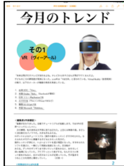
「今月のトレンド」はビジネス環境に大きな影響を与えるテーマを取りあげます。