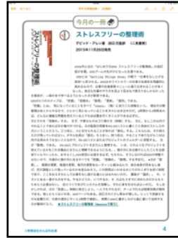
あなたにおすすめの一冊をピックアップした「今月の一冊」