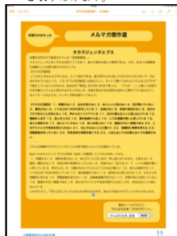
『がんばれ社長！今日のポイント』で反響が大きかった記事だけを選んで再掲するコーナー。