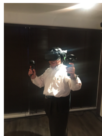
HTC 「Vive」 を体験中の編集長

「装着がおわりました。チュートリアルが起動します」 次の瞬間、私の身体は大平原に放り出された。上空には無数の星。まさしく 360度の天空パノラマである。真上には大きな月がみえる。ロボットによる チュートリアル (操作の基本レッスン) が始まった。与えられたおもちゃに興 奮する子どもにかえた気分だ。操作レッスンが済むと、ソフトを選ぶ場面 になり、今度は一瞬にして海底になった。沈没船がすぐそこにみえる。デッキの ギリギリまで歩いて底をみると、おそろしく深い海溝になっていた。ブクブク という音、なんだろうと首をひねると巨大なくじらが迫ってきた。手が届きそ うなところを悠然と横切っていく。くじらの目は象のそれに似ていることを初 めて知った。今回は1時間ぐらいで10本ほどのソフトを体験させていただいた。