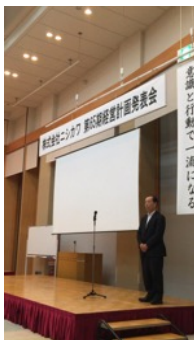
方針発表するN社長

7月2日（土）、山形県鶴岡市でN社の「第65期経営計画発表会」が行われた。N社の主力顧客は精密機器大手のNK社。「同業他社と同じ土俵で仕事をしていたら見積もり競争になる。そういうところで勝負をしていては明るい未来が描けない」と、N社長は無競争分野への進出とNK社だけを顧客にする方針を打ち出した。世界市場で戦うNK社をあと押しできるのは自分たちの技術であるという誇りと研鑽がN社をここまで押し上げてきたといえる。6月で終了した前期は高いレベルで増収増益を実現し、最高決算を更新された。財務内容もバツグンだ。しかし社長に笑顔はない。