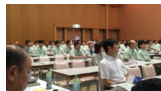
会場に社員全員と来賓が集う